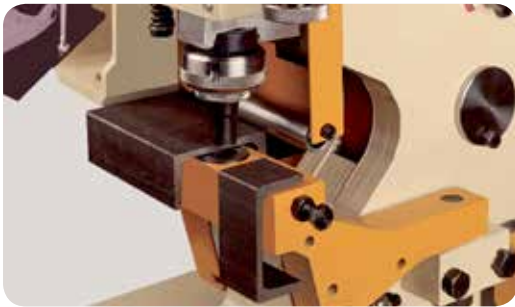
Portamatriz cuello de cisne