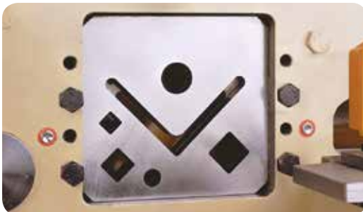
Equipo de corte de barras \varnothing y \square