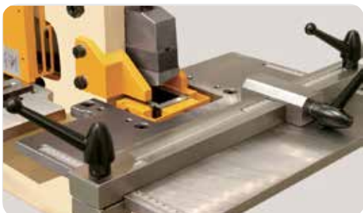
Equipo de entallado rectangular