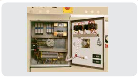
Cuadro eléctrico con elementos de protección y mando integrados