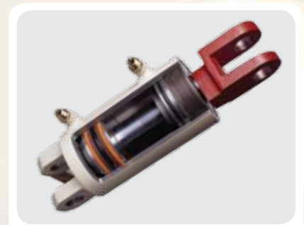
Cilindro de doble efecto