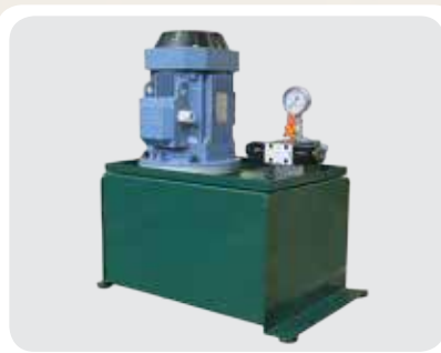
Grupo hidráulico de accionamiento eléctrico con bomba sumergida