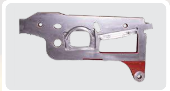
Portacuchillas monobloque con casquillos anti-fricción