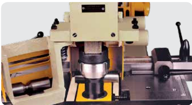
Equipo de punzonado hasta \varnothing 36 \times 8 mm de espesor