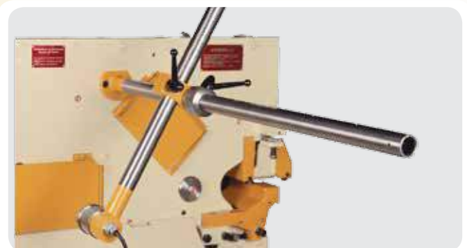
Tope eléctrico. Estación de corte de pletinas