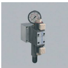
» Regulador presión mordaza