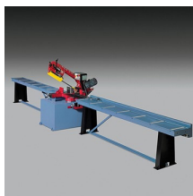
» Camino de rodillos