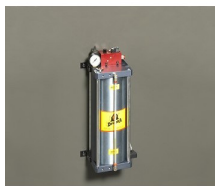
» Dispositivo de corte en seco